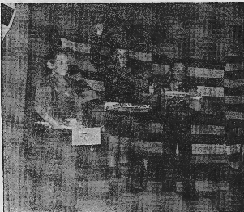
Entrega de prémios no 1.º Festival Desportivo da Casa do Gaiato de Paço de Sousa